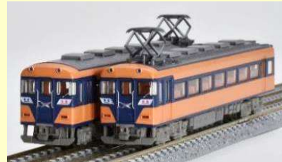
『鉄道コレクション 18200系』も2024年11月に発売予定!