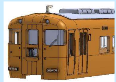
各画像は実車および試作、開発中のものです 実際の製品仕様とは異なる場合があります