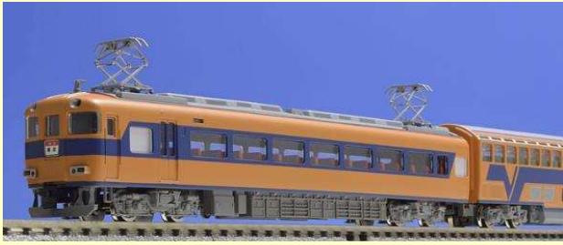
※写真は旧製品です 実際の製品仕様と異なる場合があります