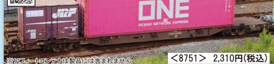
※12フィートコンテナは製品には含まれません