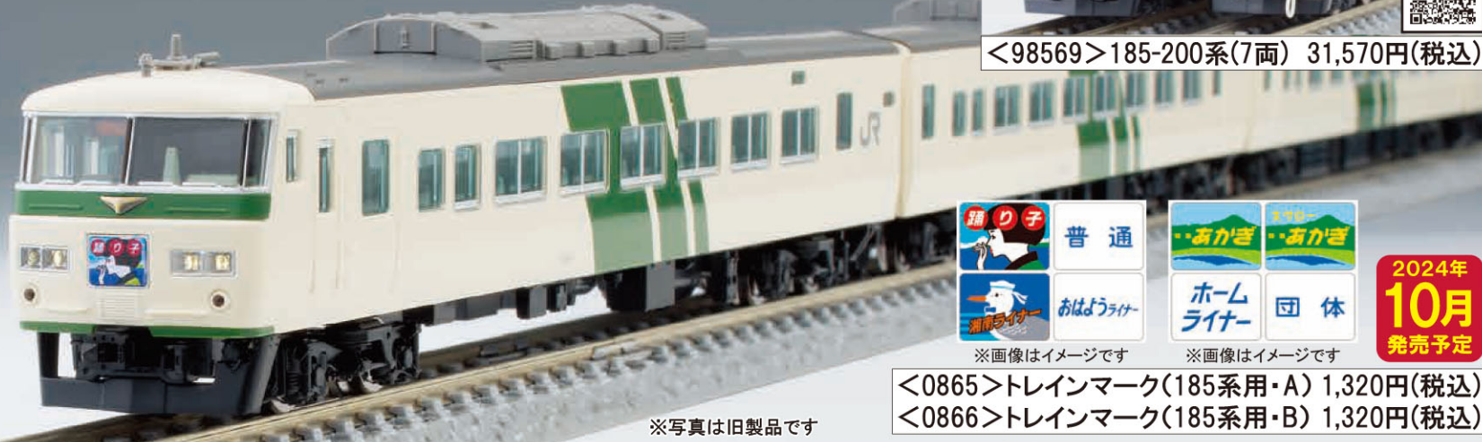
※写真は旧製品です