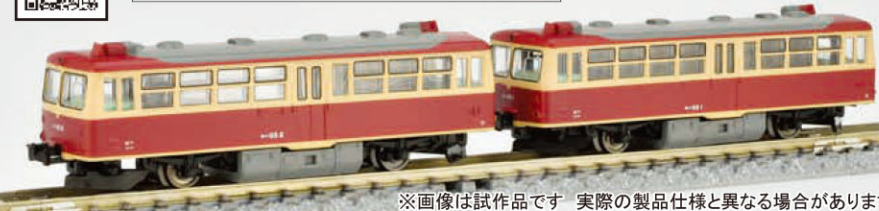
※画像は試作品です 実際の製品仕様と異なる場合があります