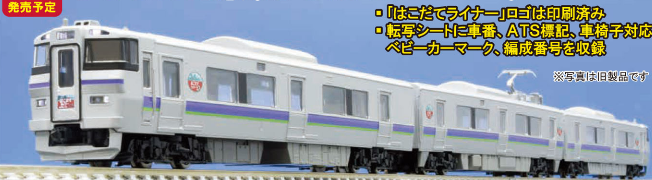
※写真は旧製品です