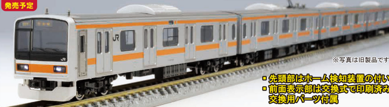
※写真は旧製品です

<98849>基本(6両) 24,420円(税込) <98850>増結(4両) 12,540円(税込)