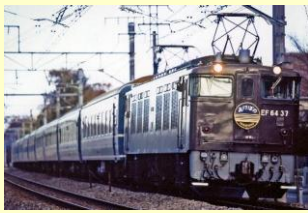
<7118> EF64-0形 (37号機・茶色)