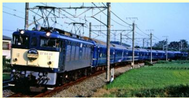
<7117> EF64-0形 (5次形・高崎車両センター)