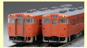
お手元のキハ47形などのキハ40系