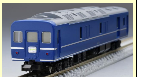
＜9538＞国鉄客車 カニ24 100形(銀帯)(T)