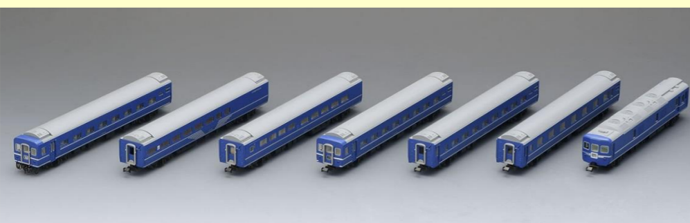
＜98802＞国鉄 24系25 100形 特急寝台客車(はやぶさ)セット