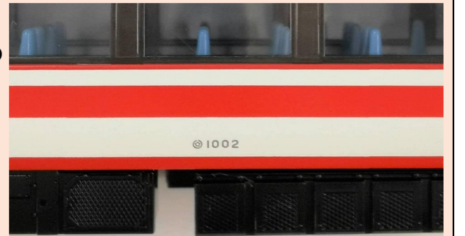
各画像は試作、開発中のものです 実際の製品仕様とは異なる場合があります