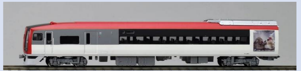
長野電鉄2000系スノーモンキー ＜別売りオプション＞ 室内灯:＜0733＞LC白色