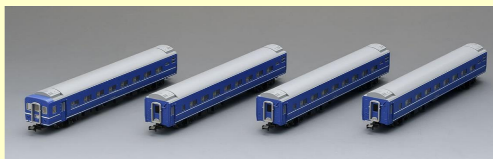
＜98803＞国鉄 24系25 100形 特急寝台客車増結セット