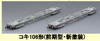
コキ106形(前期型・新塗装)