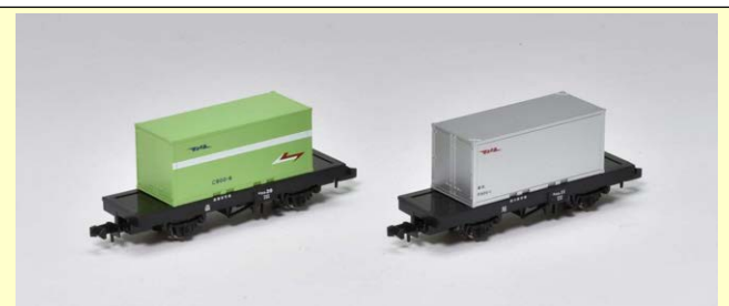
※写真は試作品のイメージです 実際の製品仕様と異なる場合があります