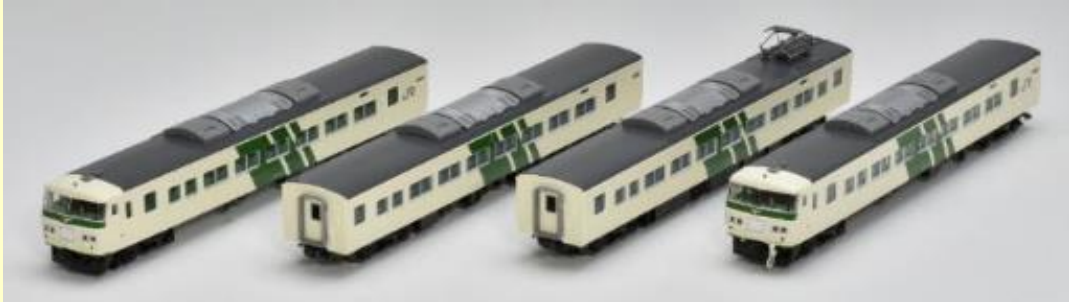
※写真は実車および旧製品組み換えによるイメージです 実際の製品仕様とは異なる場合があります