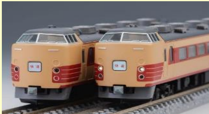
183・189系特急電車 2003年7月～2013年 (～2009年3月はムーンライトながら91・92号として)