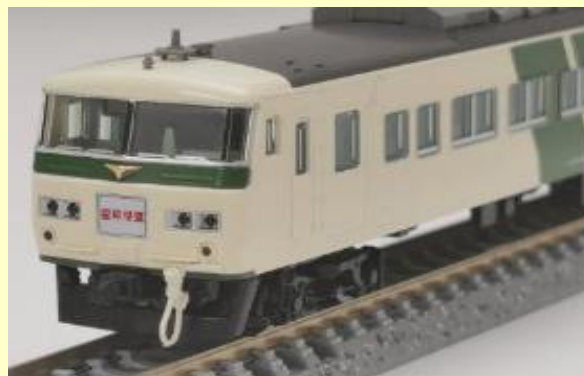
185系特急電車 2013年12月～2020年3月