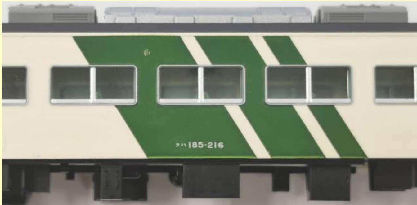
※写真は画像合成によるイメージです 実際の製品仕様と異なる場合があります