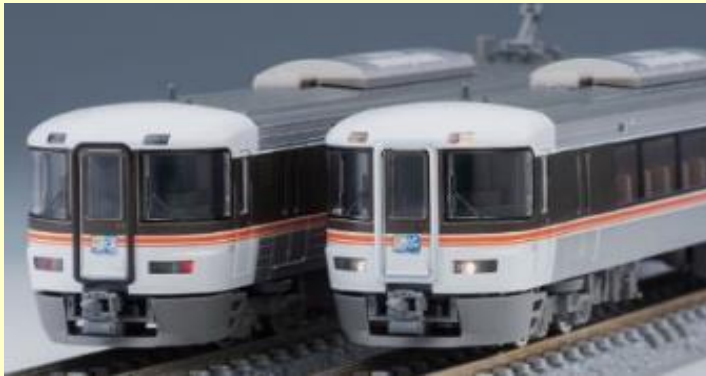
373系特急電車 1996年3月～2009年3月