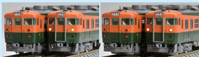
基本セット クハ165-106形 クハ165-135形 増結セット クハ165-134形 クモハ165-59形

名門列車 急行「東海」の最末期、1996年頃のK1編成、K1-1編成を再現 各先頭車はシールドビーム化改造された前面を再現 信号炎管は右側に移設された姿で、列車無線アンテナと共に装着済み