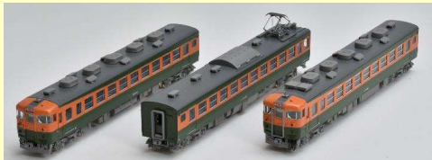
各画像は試作、開発中のものです 実際の製品仕様とは異なる場合があります