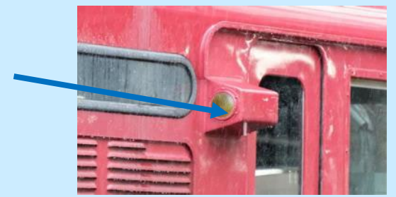
画像は実車です 実際の製品仕様とは異なる場合があります

700番代後期型のうち側面の電暖表示灯が小型のグループを側面形状の新規製作により再現