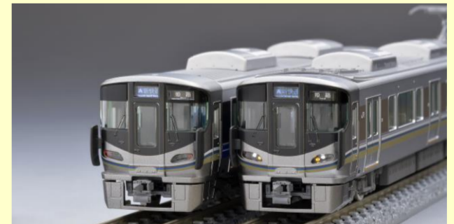
225 100系 Aシート編成同士のすれ違いも!