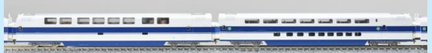
98875のX編成増結セットに入る食堂車の168 0形(左側)※画像は旧製品です

98874・98877の基本、増結セットと、98875もしくは98876各増結セットの選択でX編成またはG編成の16両編成が再現可能なセット構成