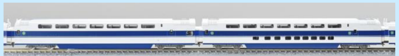
98876のG編成増結セットに入るカフェテリアの148形(左側)※画像は旧製品です

※各画像は実車および試作、開発中のもので 実際の製品仕様とは異なる場合があります