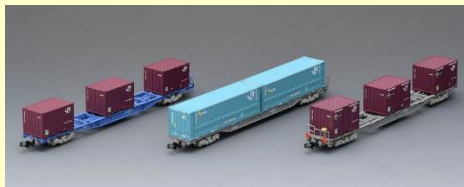
コキ106・107 コンテナ列車増結セット