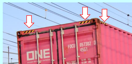
画像は実車です 実際の製品仕様とは異なる場合があります

コンテナは高さ9フィート6インチの背高タイプを再現 背高コンテナを示すコンテナ上部のゼブラ模様を再現