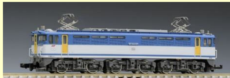
EF65-2000 復活国鉄色 EF65-2127