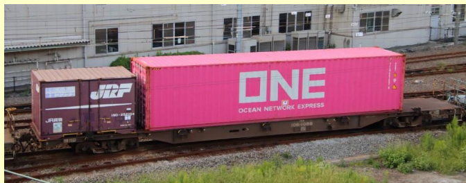
※写真は実車です 実際の製品仕様と異なる場合があります ※12フィートコンテナは製品には含まれません