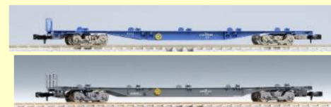
コンテナ貨車各種