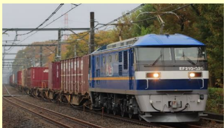
※写真はイメージです 実際の製品仕様と異なる場合があります