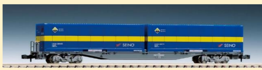
＜8731＞JR貨車 コキ107形(増備型・西濃運輸コンテナ付)