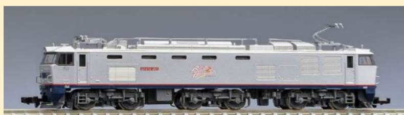
＜7163＞JR EF510 300形電気機関車(301号機)