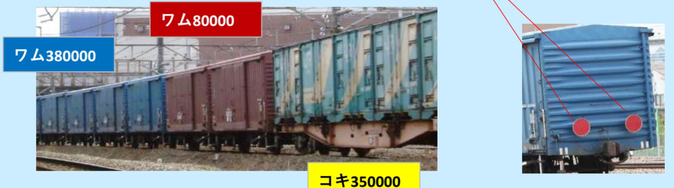
※各画像は実車です 実際の製品仕様とは異なる場合があります

茶色のワム80000、青色のワム380000とコキ350000を連結した列車を再現 ワム80000の反射板取付時を再現するための治具付属 ※反射板取り付けには穴あけ加工が必要となります