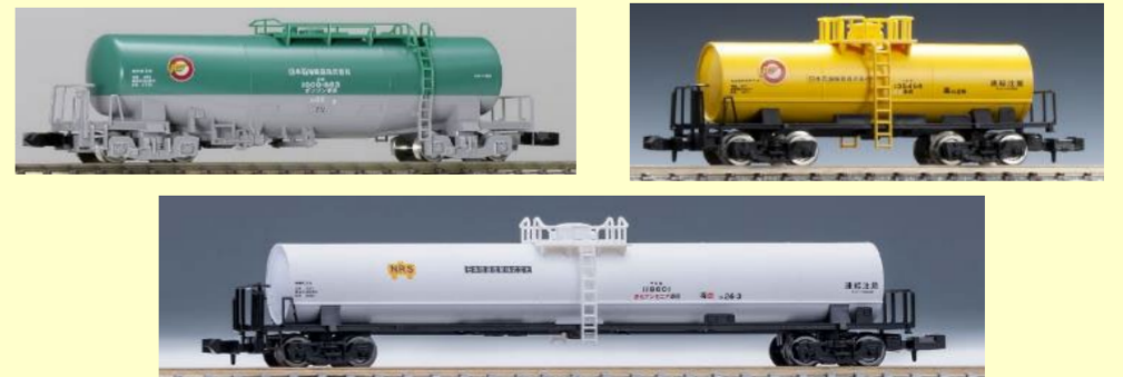
タキ1000・タキ5450・タキ18600

☞編成の長さはワム10～30両+コキ2～6両程度の場合が多く、ワムは2000年代初頭は茶色の280000番代が、2000年代後半は青色の380000番代が多く連結されていました