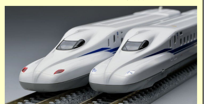
N700S 東海道・山陽新幹線 ◆別売りオプション◆ 室内灯:<0734>LC電球色