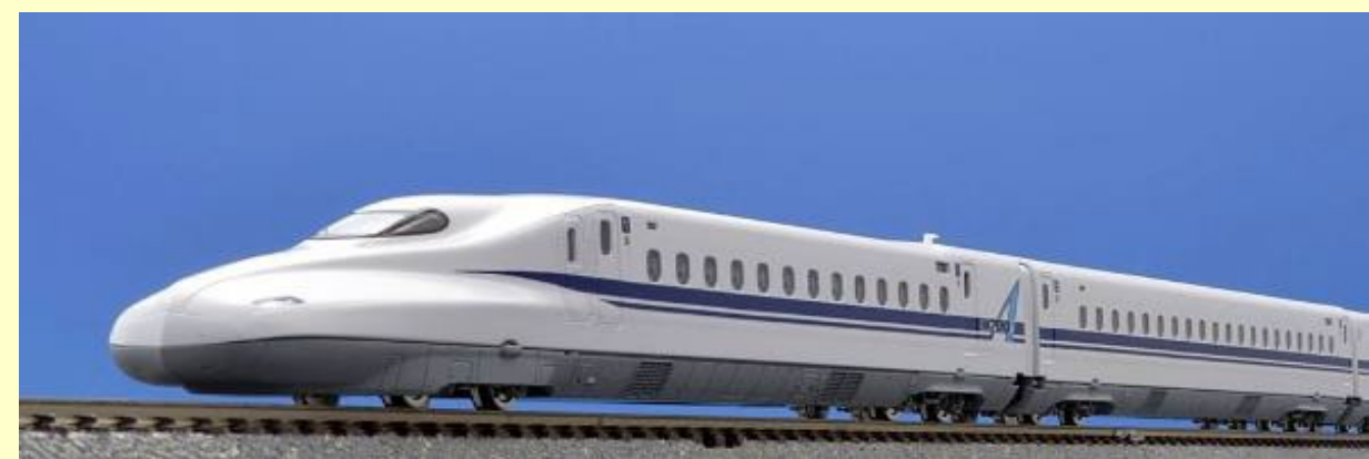
※写真は旧製品です 実際の製品仕様と異なる場合があります