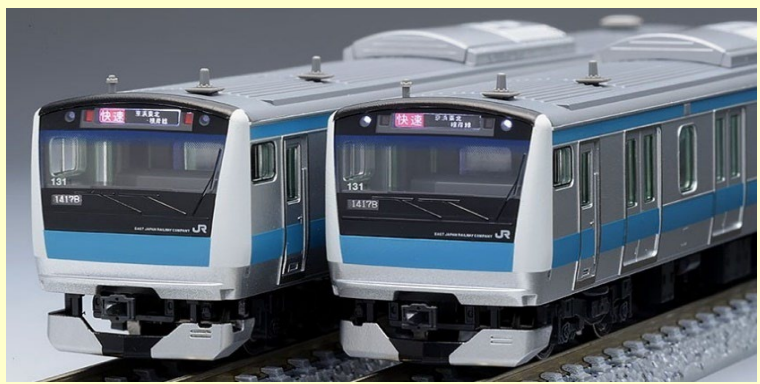
※写真は旧製品です 実際の製品仕様と異なる場合があります