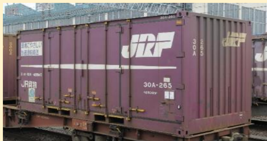
<3301>30A形コンテナ (ロゴ入り・3個入り)