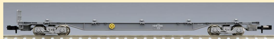
<8746>コキ106形(前期型・新塗装・コンテナなし・2両セット)