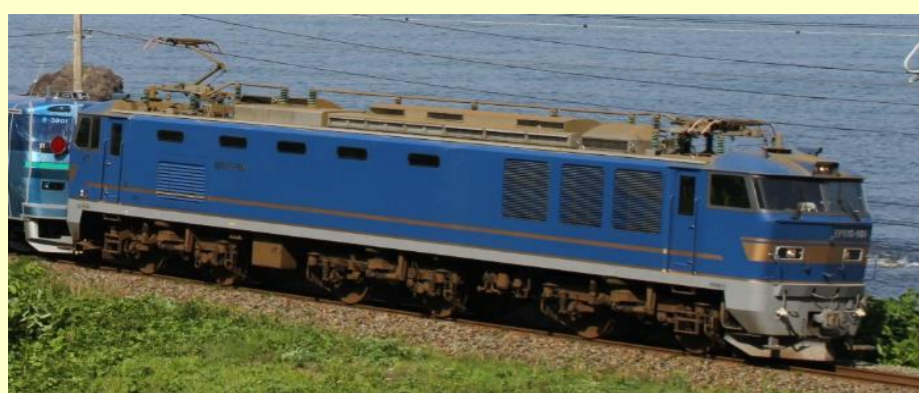
EF510 500形 JR貨物仕様・青色