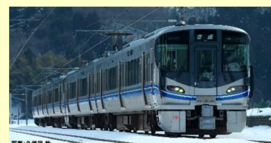
北陸本線で活躍 521系 3次車