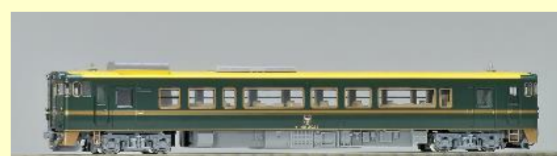
城端線・氷見線の観光列車 キハ40形 べるもんた