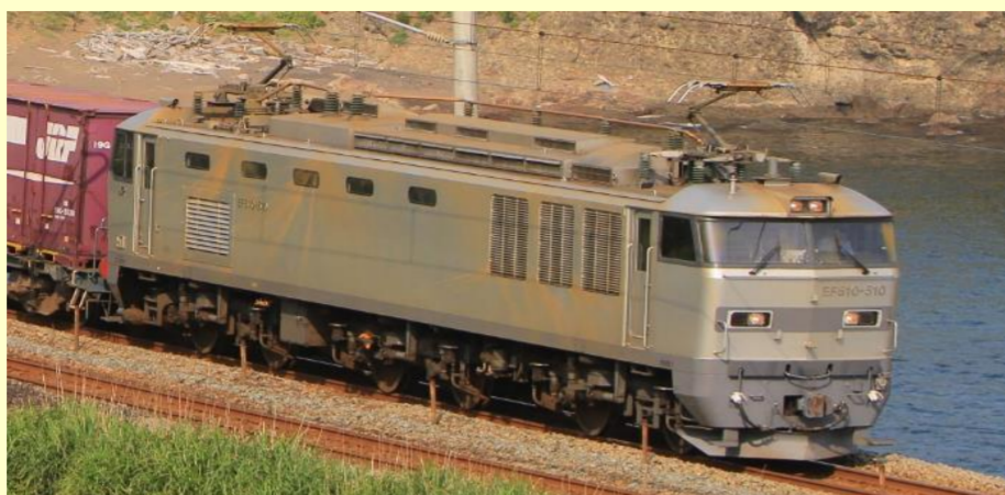
EF510 500形 JR貨物仕様・銀色