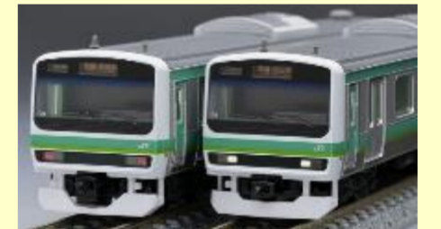
E231-0系(常磐・成田線・更新車)

<別売りオプション> 室内灯：<0733>LC白色 室内灯：<0734>LC電球色(クロ259のみ) TNカプラー：<0336>密連形