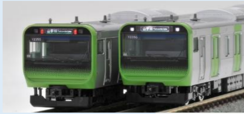
※写真は旧製品です