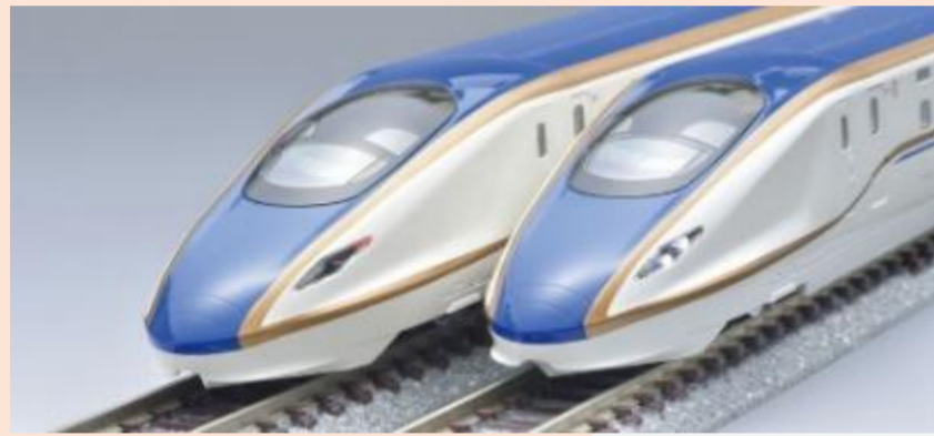
※写真は旧製品です