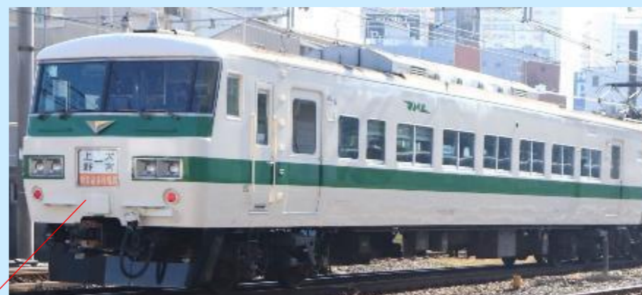
タイフォンカバー

185系0番代を塗装変更し運転された「新幹線リレー号」を再現 0番代ながら前面にタイフォンカバーの設置された姿を再現