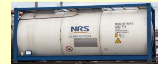
ISO20ftタンクコンテナ(フレームタイプ・NRS)