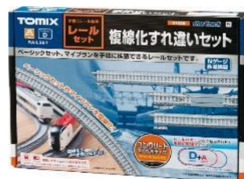
＜91028＞ レールセット複線化 すれ違いセット