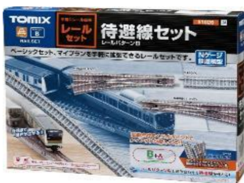
＜91026＞ レールセット待避線セット (レールパターンB)