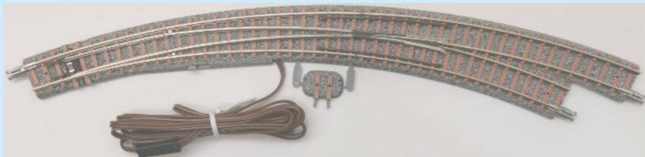
電動合成枕木ポイントCPL317/280-45-SY(F)

POINT:2 合成枕木のカーブポイント2種は本セットにのみ付属 電動合成枕木ポイントCPR317/280-45-SY(F)