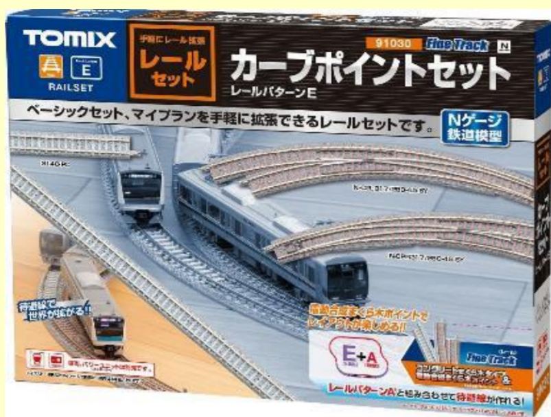
※写真はイメージです 実際の製品仕様と異なる場合があります