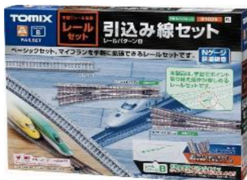
＜91025＞ レールセット引込み線セット (レールパターンB)