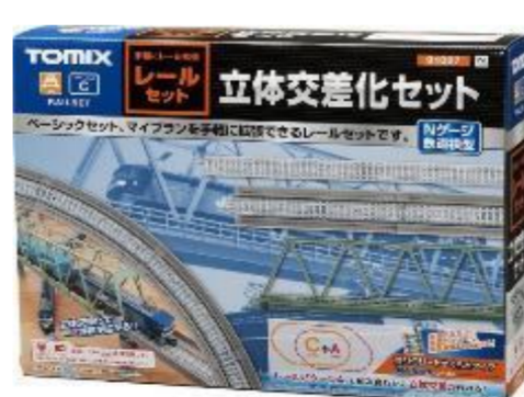
＜91027＞ レールセット立体交差化セット