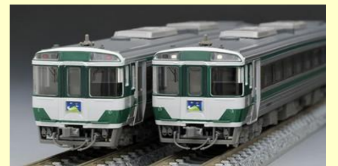
キハ185系特急ディーゼルカー 復活国鉄色