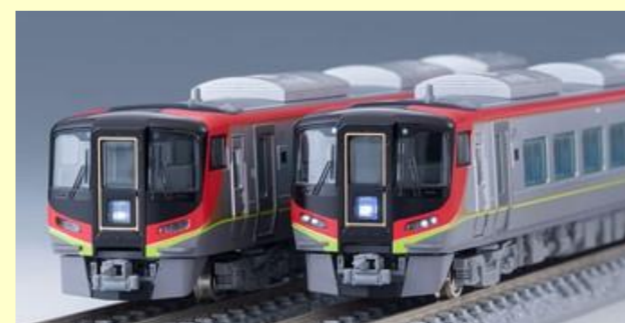
2700系特急ディーゼルカー