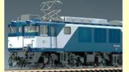
EF64形1000番代電気機関車