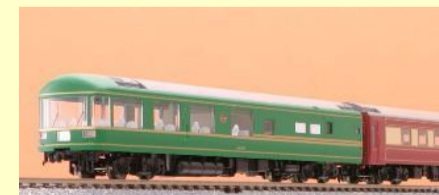
24系25形(夢空間北斗星)