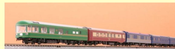
24系25形 夢空間北斗星