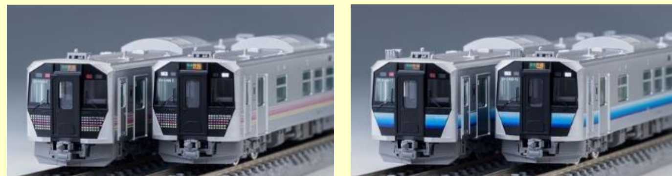
上記予定のGV-E401・GV-E402形との 連結運転も楽しめる両運転台車 GV-E400形