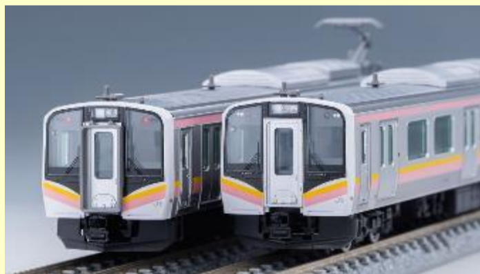
新潟地区を GV-E400系と 共に走り抜ける E129系