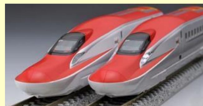
東京と秋田を結ぶ 赤い新幹線 E6系 秋田新幹線