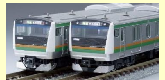
JR E233 3000系