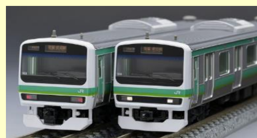
JR E231 0系(常磐・成田線)