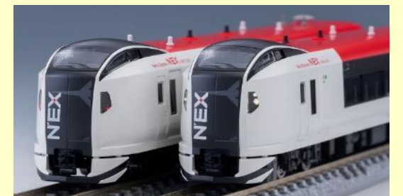
JR E259系 成田エクスプレス