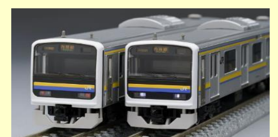
JR 209 2100系