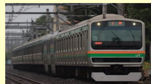
JR E231 1000系(更新車)