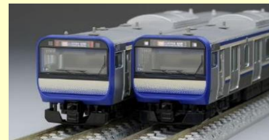
JR E235 1000系