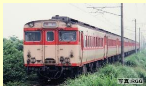
キハ58系 ときわ・奥久慈