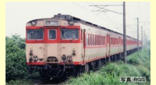
キハ58系 ときわ・奥久慈