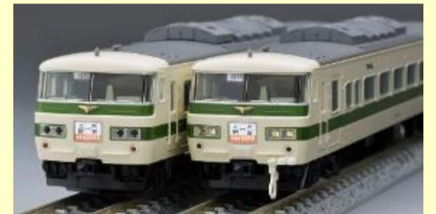
185-200系 新幹線リレー号