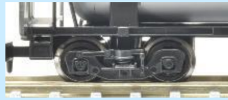
画像は試作、開発中のものです 実際の製品仕様とは異なる場合があります