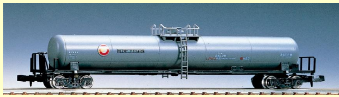
※写真は旧製品です 実際の製品仕様と異なる場合があります