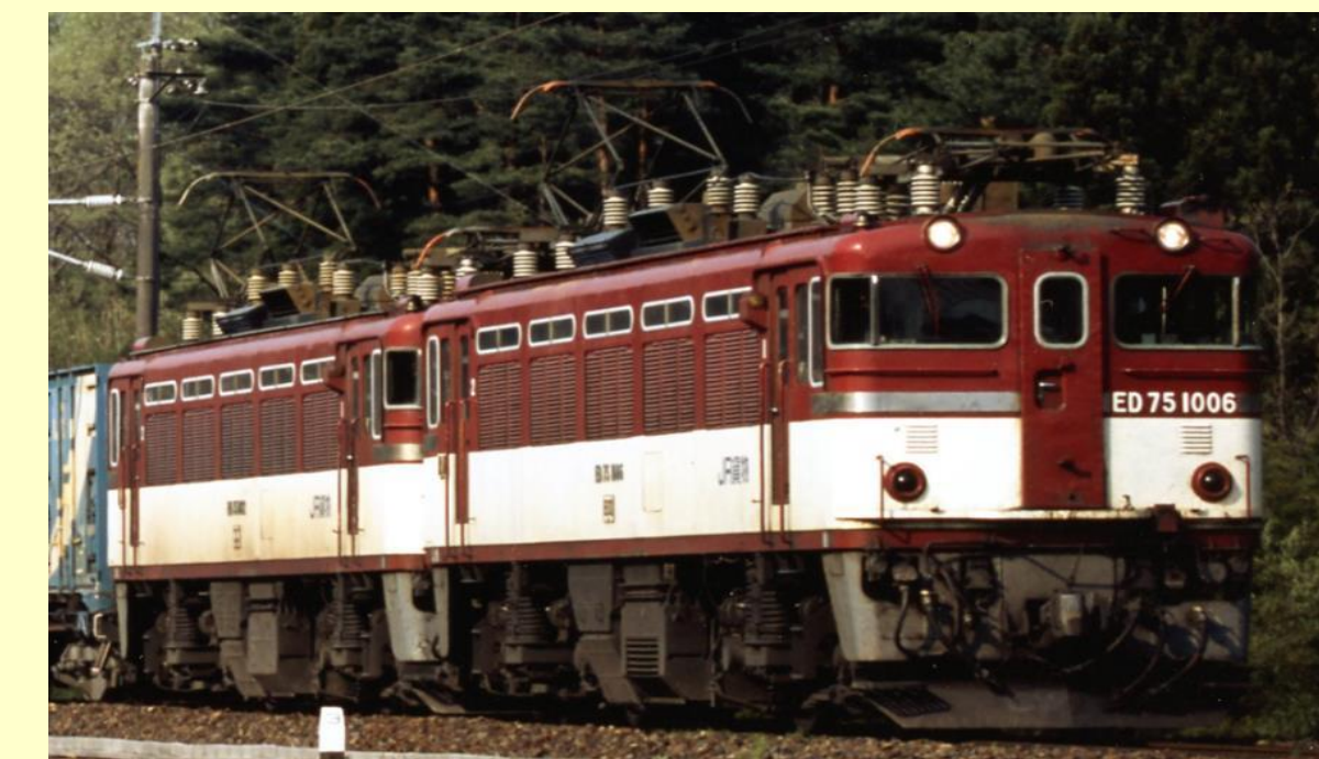
※写真はイメージです 実際の製品仕様と異なります