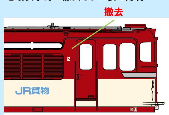
各画像は試作、開発中のものです 実際の製品仕様とは異なる場合があります