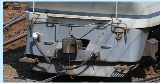
各画像はイメージです 実際の製品仕様とは異なる場合があります