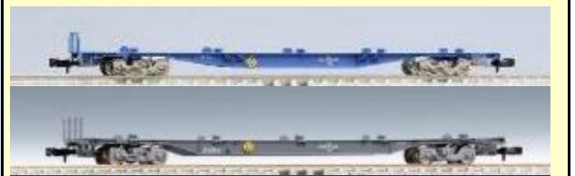
コキ104・106(後期型)・107形