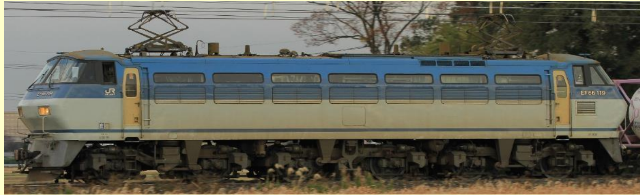
※写真はイメージです 実際の製品仕様と異なる場合があります