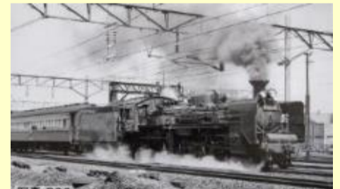
C55形(3次形・北海道仕様)