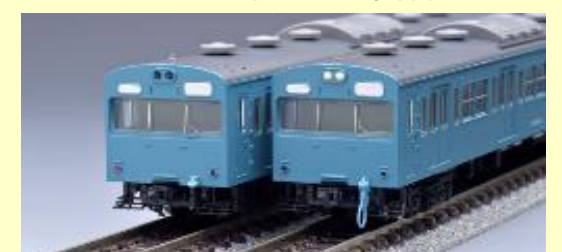
103系新製冷房車・スカイブルー