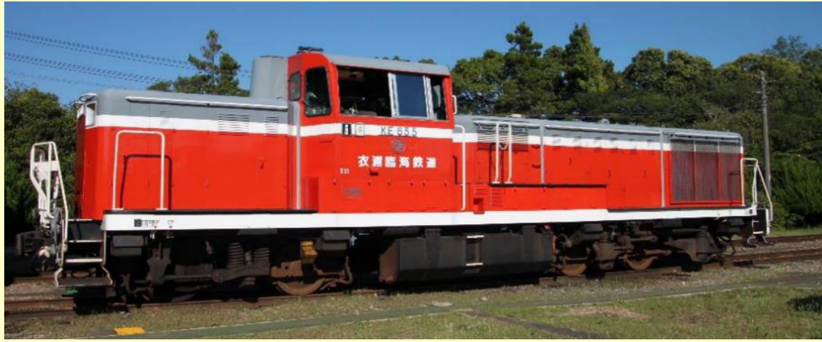
※写真はイメージです 実際の製品仕様と異なる場合があります