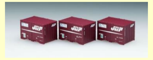
19D・UR19A等コンテナ各種