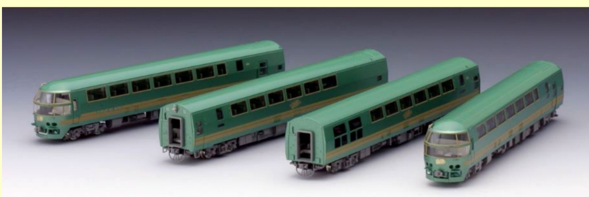
※写真は旧製品です 実際の製品仕様と異なる場合があります