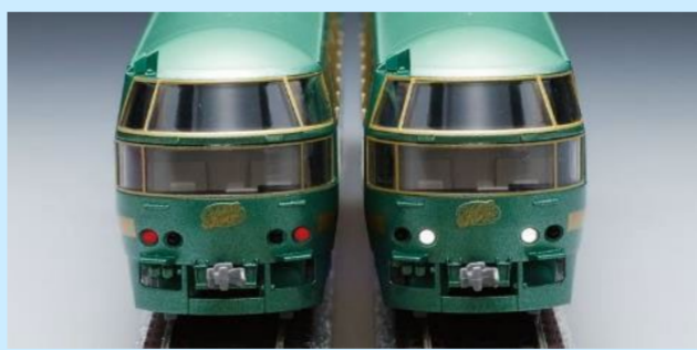
写真は旧製品です 実際の製品とは異なる場合があります