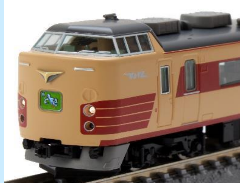
各画像は試作、開発中のものです 実際の製品とは異なる場合があります