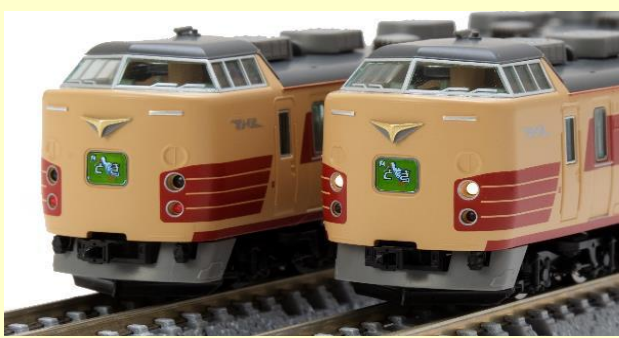
※写真は試作品です 実際の製品仕様と異なる場合があります