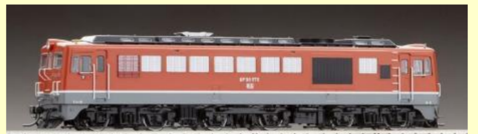
DF50形ディーゼル機関車各種