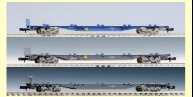
コンテナ貨車 各種