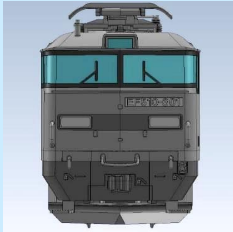
各画像は試作、開発中のものです 実際の製品とは異なる場合があります