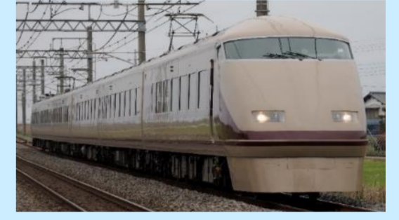
写真は実車でイメージです 実際の製品とは異なる場合があります