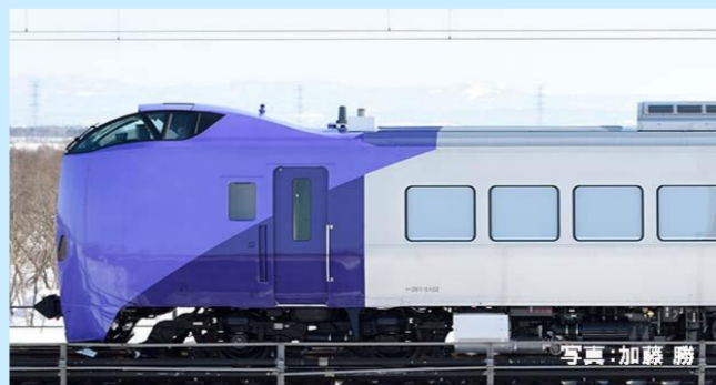
写真は実車でイメージです 実際の製品とは異なる場合があります