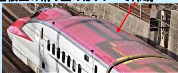
写真は実車でイメージです 実際の製品とは異なる場合があります

＜別売りオプション＞ 室内灯:<0733>LC白色 室内灯:<0734>LC電球色