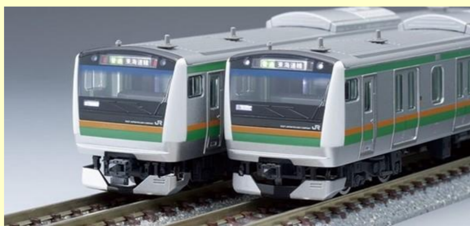
※写真は旧製品です 実際の製品仕様と異なる場合があります