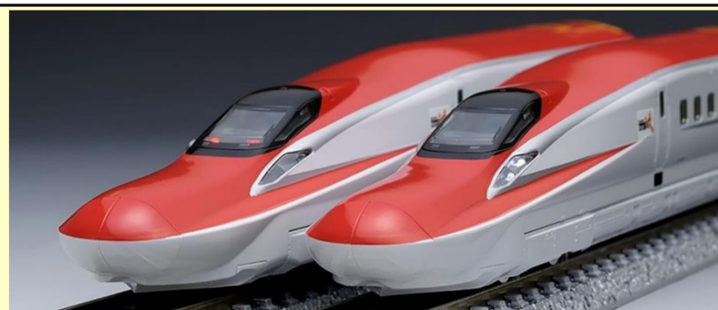
※写真は旧製品です 実際の製品仕様と異なる場合があります