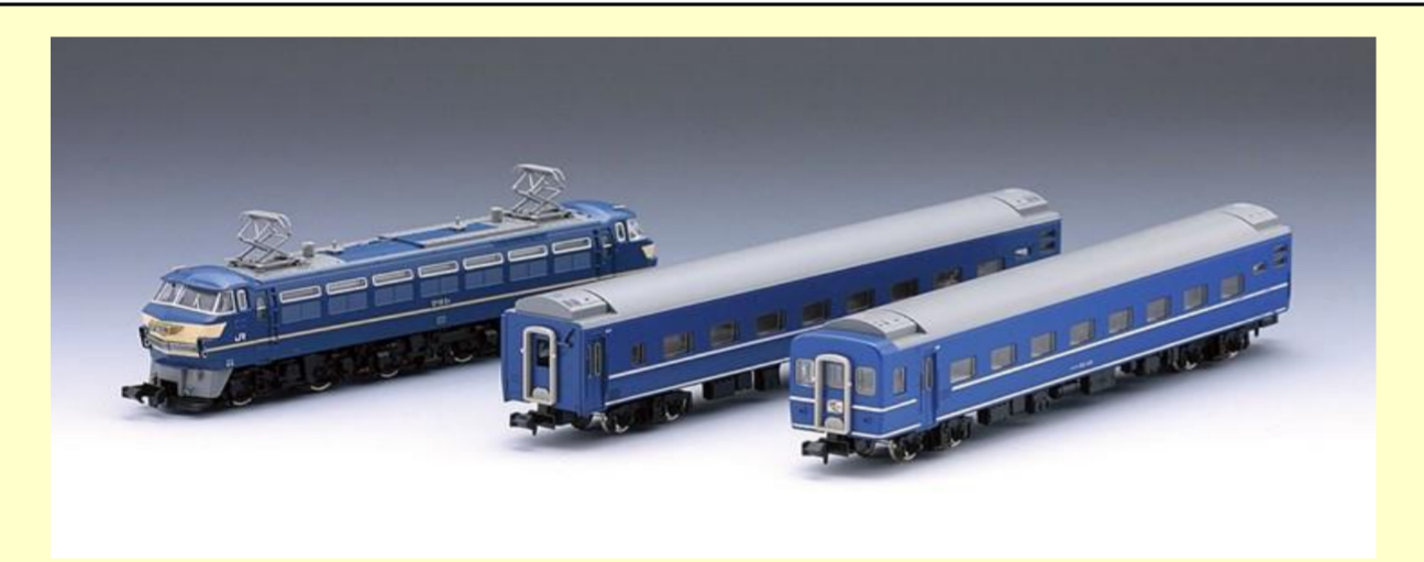
※写真は旧製品です 実際の製品仕様と異なる場合があります

JR東日本商品化許諾申請中 JR東海承認申請中 JR西日本商品化許諾申請中 JR九州承認申請中