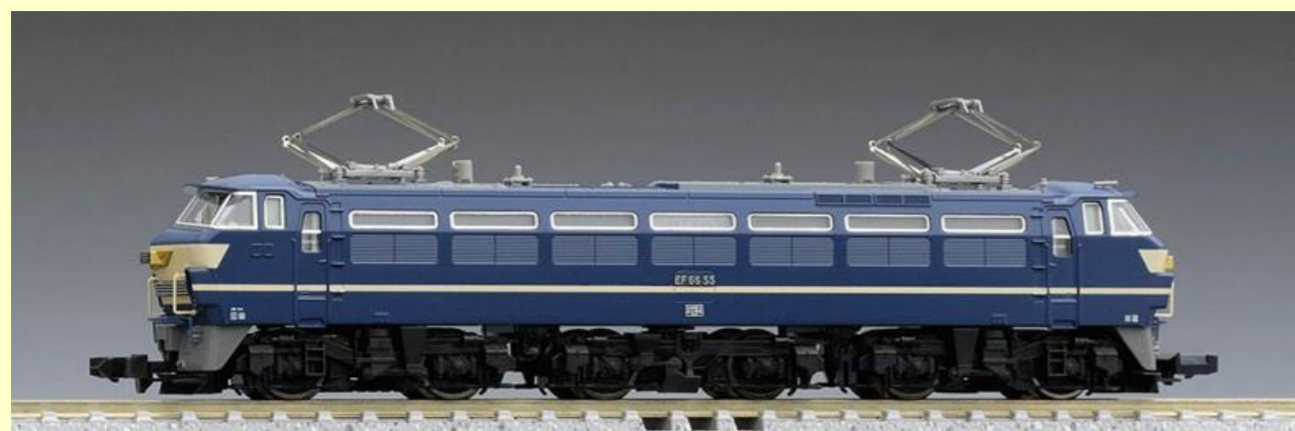
※写真は旧製品です 実際の製品仕様と異なる場合があります