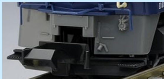
各画像は旧製品です 実際の製品とは異なる場合があります