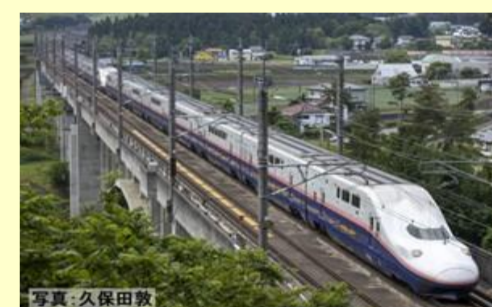
E4系上越新幹線(新塗装)