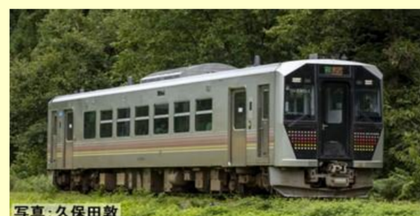
GV-E400形ディーゼルカー(新潟色)