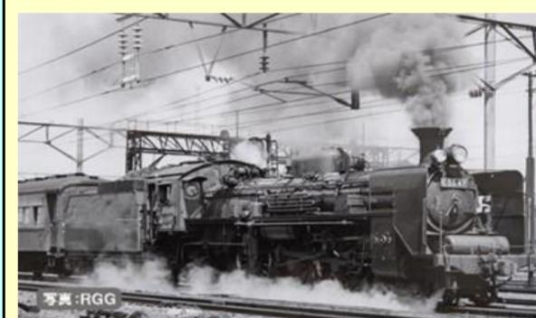
C55(3次形・北海道仕様)

<別売りオプション> 室内灯：<0734>LC電球色 TNカプラー：<0373>自連形