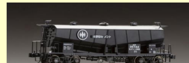
ホキ5700形キット 好評発売中