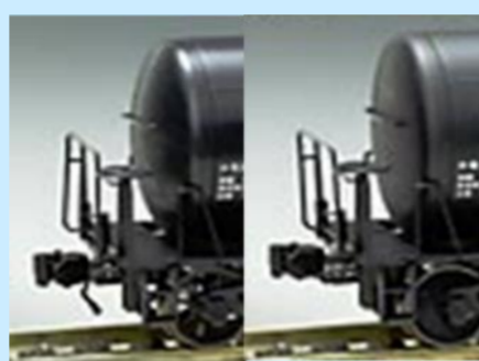
※製品の車輪はボックス輪心となります