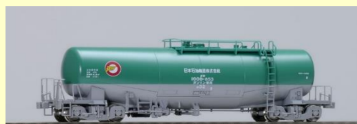
タキ1000形 好評発売中