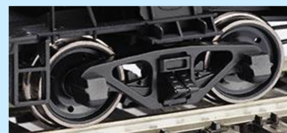
各画像は旧製品です 実際の製品とは異なる場合があります