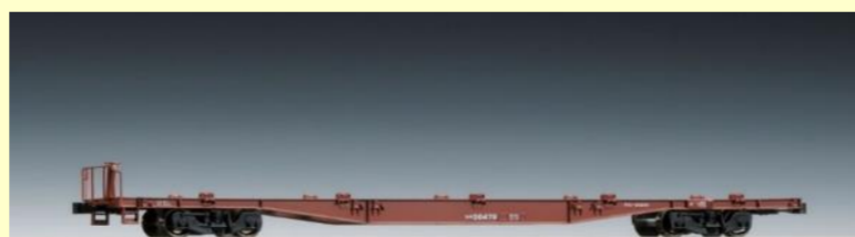
コキ50000形 好評発売中