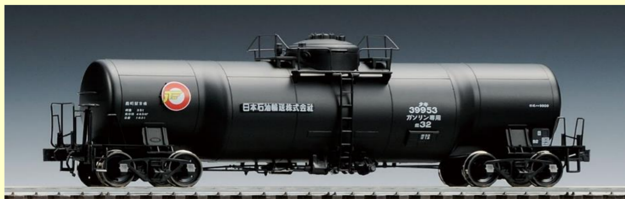
※写真は旧製品の組み立て見本です 実際の製品仕様と異なる場合があります