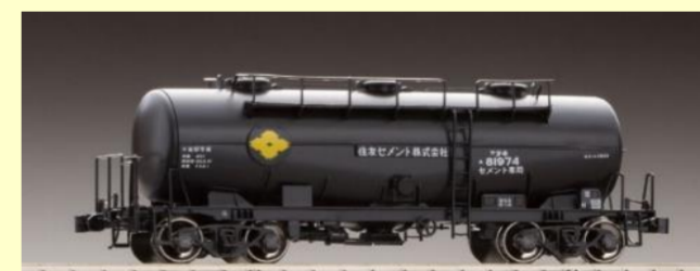
タキ1900形キット 好評発売中