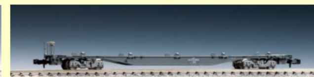
コキ107形 (増備型・コンテナなし)