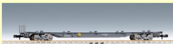
コキ106形 (後期型・新塗装・コンテナなし)