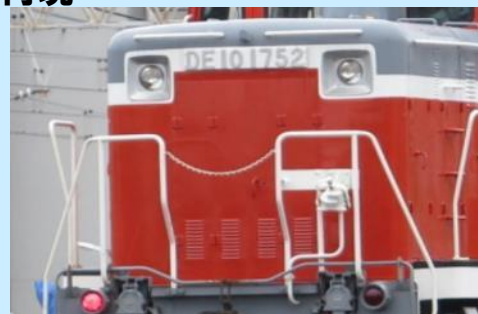
写真は実車でイメージです 実際の製品とは異なる場合があります