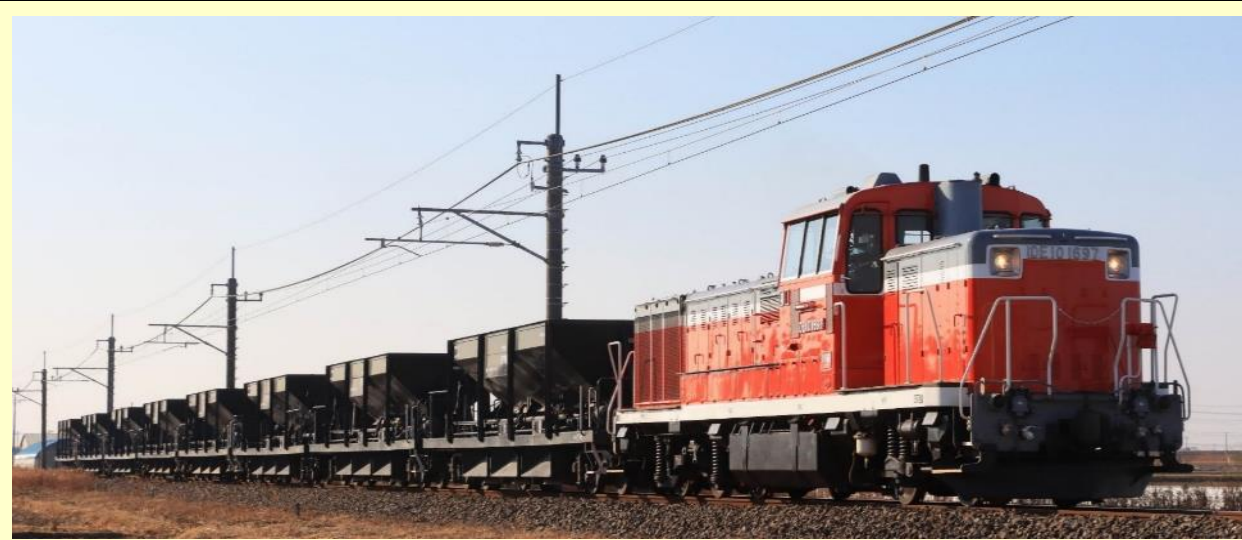
※写真はイメージです 実際の製品仕様と異なる場合があります