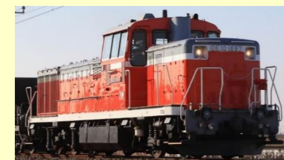
DE101000形(高崎車両センター) 2022年9月発売予定