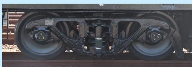
写真は実車でイメージです 実際の製品とは異なる場合があります