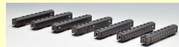
旧型客車(高崎車両センター) 好評発売中