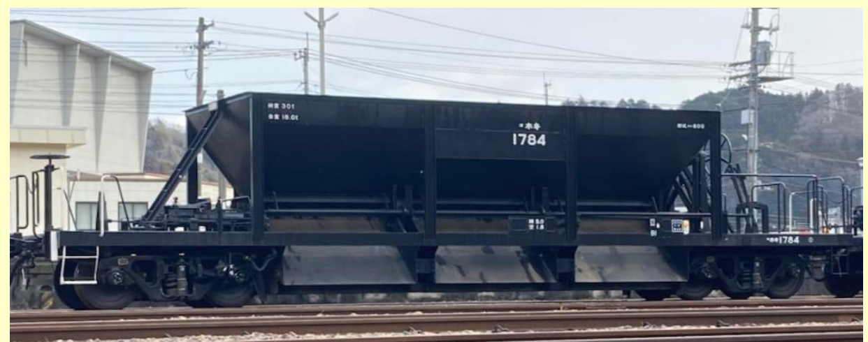
※写真はイメージです 実際の製品仕様と異なる場合があります