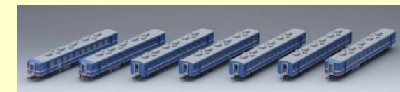
12系(高崎車両センター) 好評発売中