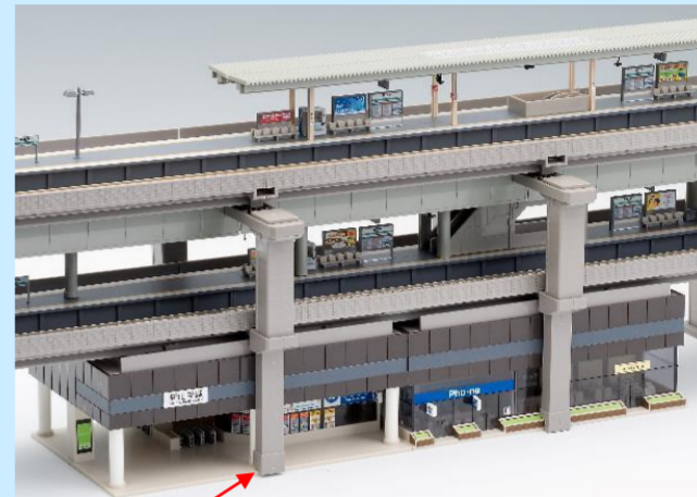
高架駅用橋脚 駅を2段以上階層化する時に使用します