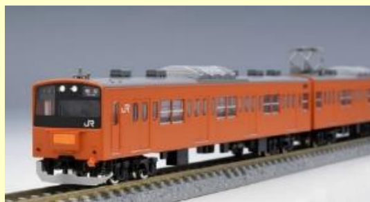
201系(中央線・分割編成) 好評発売中