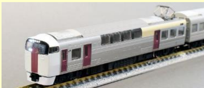
215系(2次車) 2022年2月発売予定