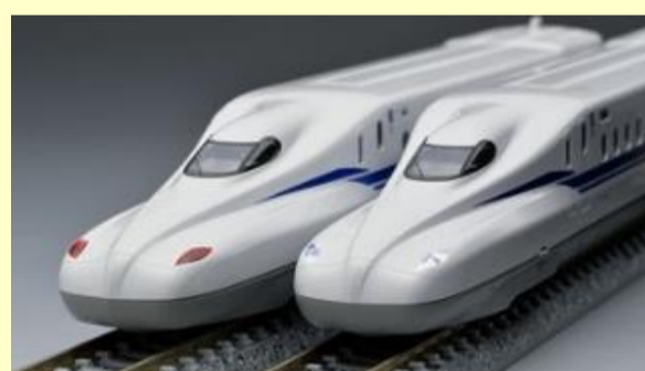
N700系(N700S)東海道・山陽新幹線 好評発売中