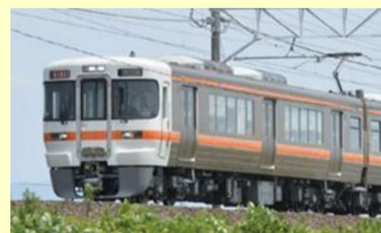
313 5000系近郊電車 5月発売予定